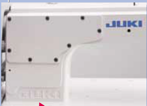
reliéfne JUKI logo

Pri objednávaní kontaktujte KAPEX s.r.o.