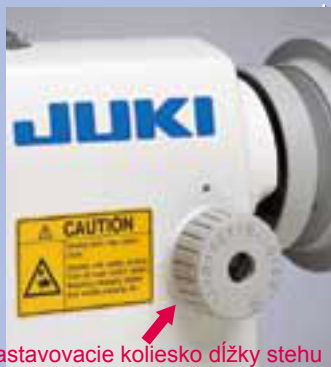
Nastavovacie koliesko dĺžky stehu

Vysoko spoľahlivý a odolný podávací mechanizmus zaisťuje šitie presných a kvalitných stehov aj pri ich maximálnej dĺžke.